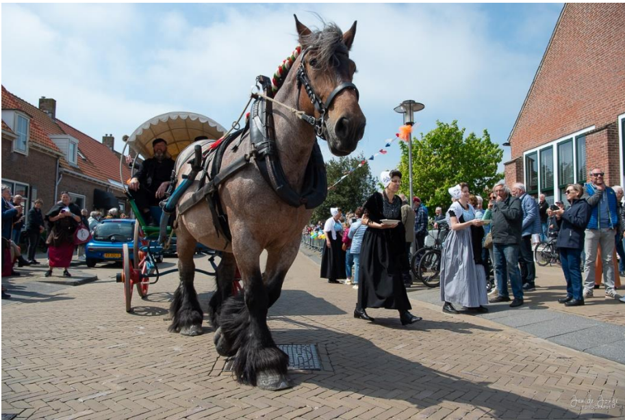
SCW-wagen in de optocht op 13 mei 2023

Uiteraard nam de SCW deel aan de historische optocht op 13 mei 2023 met een authentieke bespannen verenwagen geflankeerd door een klederdrachtengroep (zie ook de foto in de kop van dit jaarverslag).