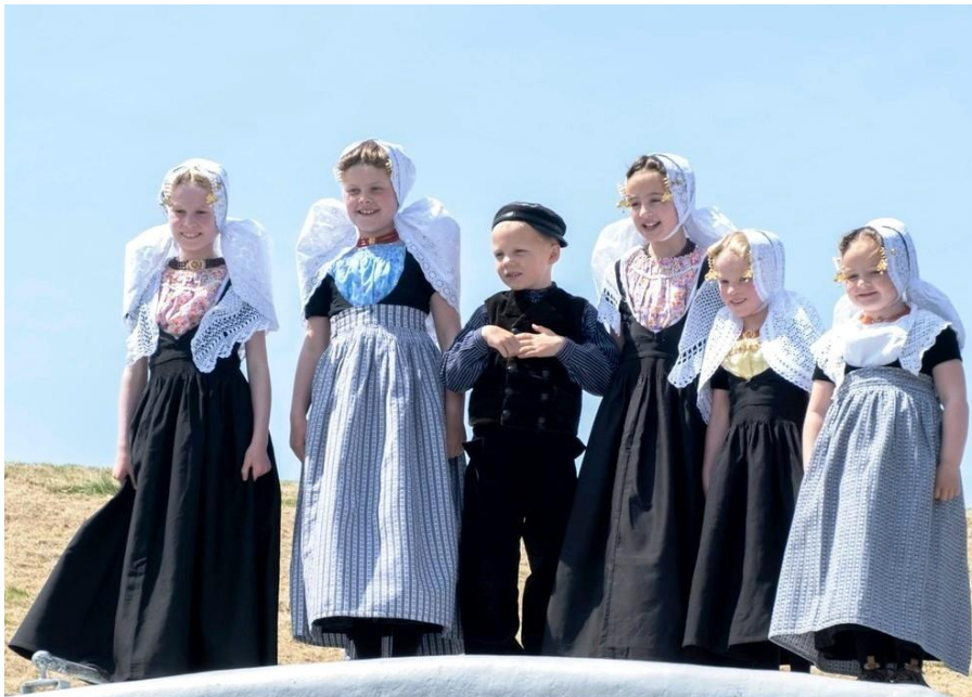
2 e Pinksterdag in Westkapelle

De klederdrachtencollectie, opgebouwd door de voormalige gemeente Westkapelle en later uitgebreid door de SCW, is opgeslagen in kasten in de SCW-ruimte in het verenigingsgebouw "Westkapelle Herrijst". Diverse, uit schenkingen verkregen, klederdrachtstukken konden aan de collectie worden toegevoegd.